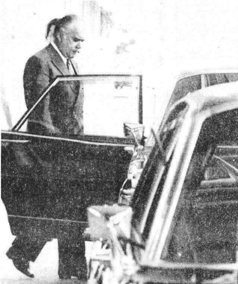
Sarney deixa o Planalto: mais derrotas que vitórias