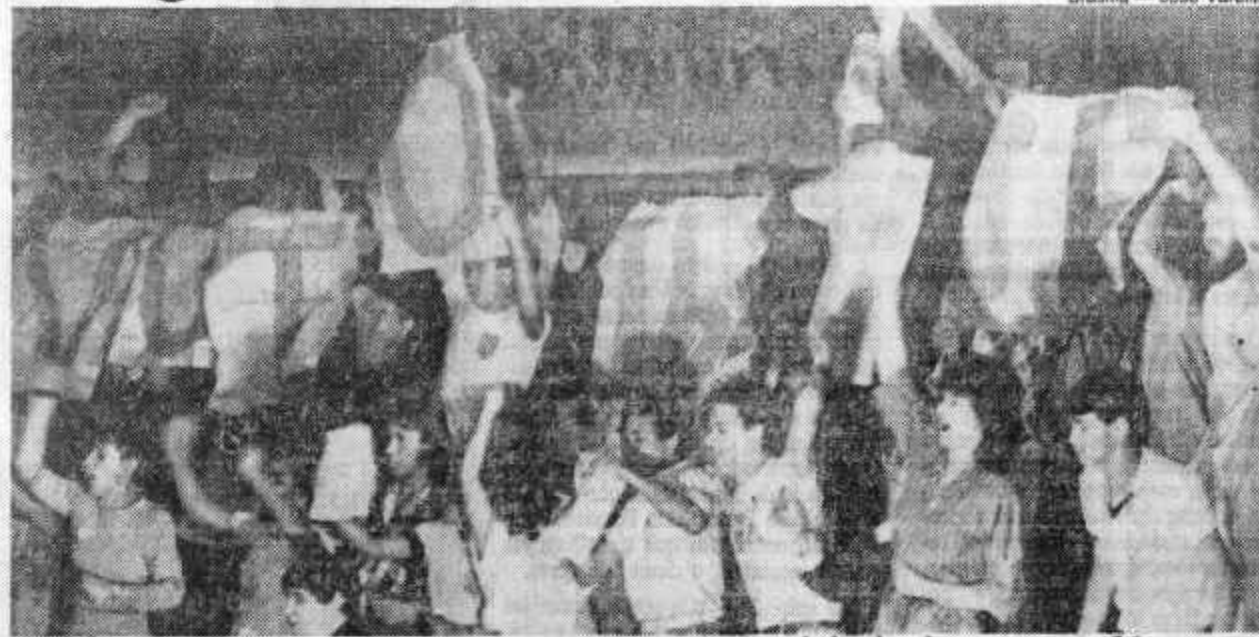
Ao som do Ultraje a rigor , jovens ocuparam as galerias defendendo o voto aos 16

O TSE não em condições de reabrir o prazo depois da promulgação da Carta.