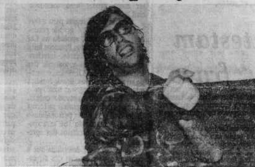
Lobão proporia lei para melhorar o direito autoral

Na votação dos direitos políticos, ontem, só não passou o instrumento do veto popular.