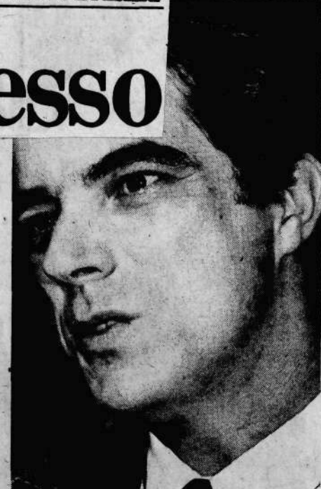
A emenda Sarney empolga Maciel, agrada Gusmão e "pode ter um papel híbrido", segundo Costa Couto