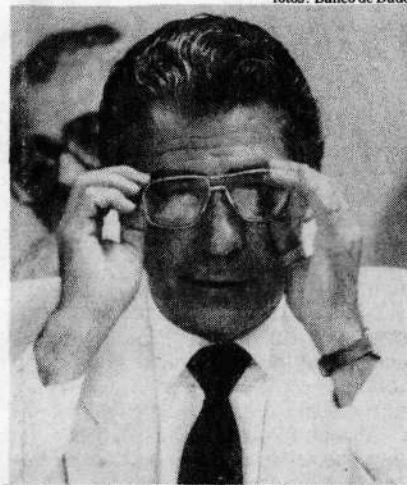
O senador Mário Covas