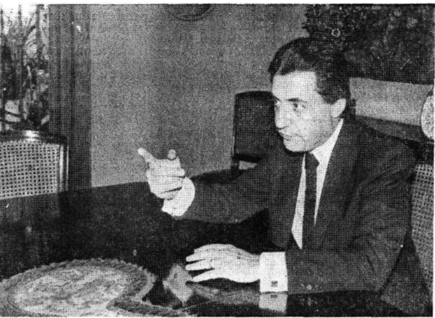
Afif condena com veemência a tendência estatizante

Hoje, concluiu o deputado constituinte, todos os que defendem o status quo e o próprio avanço do Estado sobre os espaços, que deveriam ser ocupados pela sociedade e sua força de trabalho e criatividade, são fascistas travestidos de progressistas.