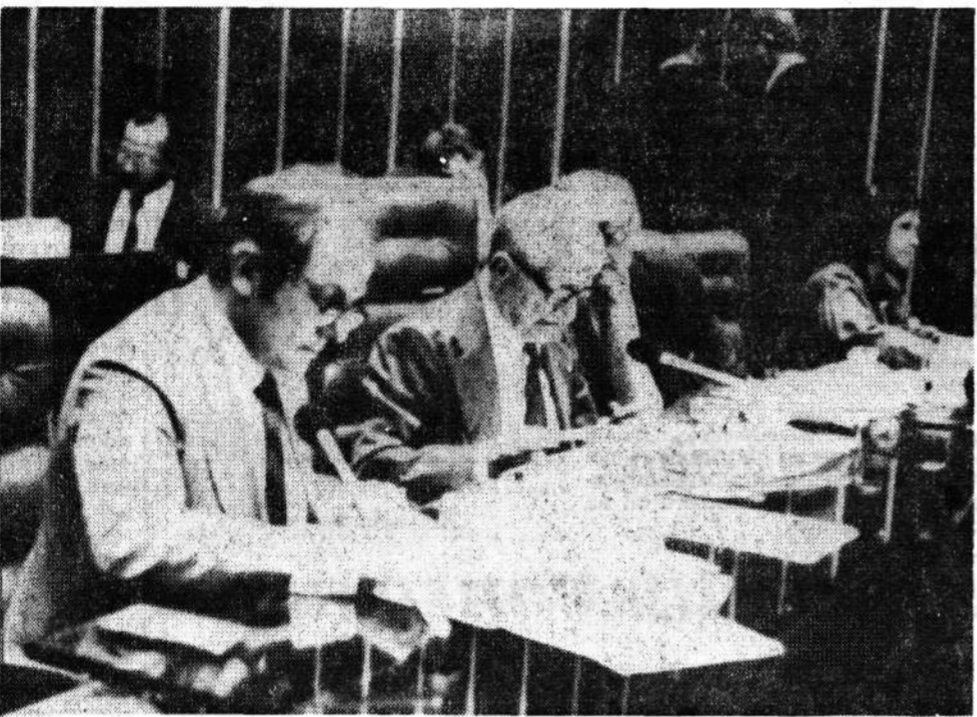
Na primeira reunião, muita calma; na segunda, só tumultos

Os deputados que pretendiam a aprovação do mérito do projeto saíram de plenário, tentando evitar quórum. Mesmo assim Arinos iniciou a votação simbólica, dando a matéria como aprovada. A decisão provocou tumulto, com o grupo favorável ao projeto de decisão mostrando falta de habilidade, já que não escalou nenhum constituinte para pedir a verificação de presença. O deputado Haroldo Lima chegou a acusar o senador Afonso Arinos de ter se deixado pressionar por Carlos Sant'Anna e por "aqueles que estão envolvidos na dívida". Já Ademir Andrade (PMDB-PA) gritou para Sant'Anna que ele era um "penetra dentro do PMDB". No final, os parlamentares favoráveis ao projeto de Hermes Zanetti consideraram que a iniciativa não foi arquivada, argumentando que a sessão não foi encerrada formalmente, o resultado não foi proclamado e não foi feita a verificação de quórum solicitada.