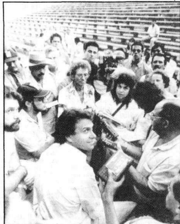
Ronaldo Caiado, líder da UDR, concede entrevistas

BRASÍLIA — Nem mesmo o Presidente da União Democrática Ruralista, Ronaldo Caiado, sabe o número de proprietários rurais acampados no Parque da Cidade, maior área de lazer de Brasília. Mas para hoje, às 9 horas, ele espera realizar uma passeata com entre 30 e 40 mil pessoas. Os participantes do movimento, denominado de "Caminhada cívica", cobrirão um percurso de cinco quilômetros ao longo da Esplanada dos Ministérios e têm como principal objetivo desfilar em frente ao Congresso Nacional para chamar a atenção dos Constituintes para o poder de pressão e mobilização da entidade.