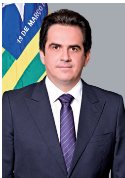
Ciro Nogueira Ciro Nogueira Lima Filho PP – Piauí