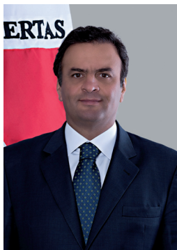
Aécio Neves Aécio Neves da Cunha PSDB – Minas Gerais