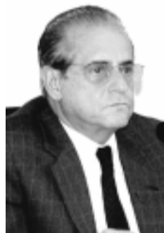
Tebet acha que TRT-SP é agora "matéria esgotada"