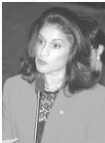
Emilia lembra que atualmente escolas fazem o levantamento mas não divulgam os dados

O projeto fixa o prazo de dois meses após a conclusão do ano letivo para que as escolas enviem os índices de evasão e repetência aos sistemas de ensino do estado e do município onde se situam. Também prevê que esses sistemas deverão divulgar, até o último dia do mês de abril de cada ano, um