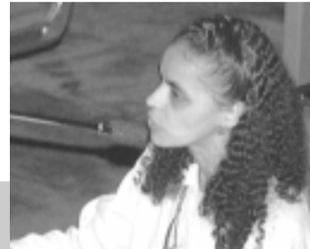
Marina Silva lembrou que aviões são vitais para transporte de remédios e alimentos

Marina Silva lembrou que algumas regiões do país que dependem dos aviões da FAB para transportar alimentos, remédios e pessoas doentes encontram muitas dificuldades para sua utilização. A senadora disse que queria, com seu pronunciamento, fazer uma comparação de um benefício de tão fácil acesso por parte de alguns e, ao mesmo tempo, “caso de vida ou morte para outros”.