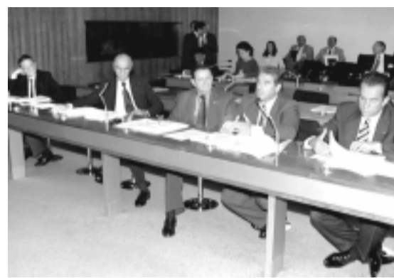
As matérias aprovadas ontem na Comissão de Educação vão para a decisão final do plenário

Atualmente, segundo o parecer de Emilia Fernandes, as escolas de ensino médio e fundamental, ao término do período letivo, fazem o levantamento do número de repetentes e de alunos que evadiram. Porém, acrescenta a senadora, não é comum que esses índices sejam divulgados, como propõe o projeto da Câmara dos Deputados.