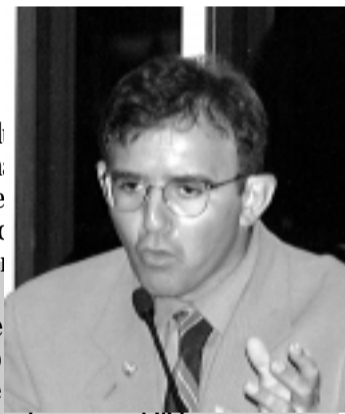
Eduardo Siqueira Campos defendeu a criação da Secretaria Nacional de Recursos Hídricos do país

vidas pelo governo do estado do Tocantins para o uso múltiplo e sustentável das águas da bacia do rio Tocantins, que há muitos anos é utilizado na produção de energia elétrica, foram chamadas por Eduardo Siqueira Campos como projetos viáveis e importantes para o país. Além de continuar servindo ao programa energético, explicou o senador, o governo pretende que as águas do rio Tocantins também sejam utilizadas na irrigação, navegação fluvial, turismo e lazer e produção de alimentos.