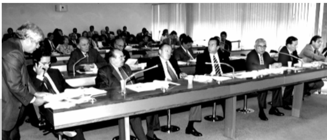
Na reunião de ontem, a CAE adiou votação de projeto tratando da aplicação da receita das privatizações

Na reunião de ontem, a CAE aprovou pedido de vista coletivo para o Projeto de Resolução nº 6, de autoria do senador José Agripino (PFL-RN), que propõe modificação nas condições para refinanciamento dos títulos públicos, emitidos para pagamento de precatórios, e a proibição para a emissão de novos títulos pelos estados e municípios que tiverem sua dívida mobiliária refinanciada. O projeto de Agripino, com apoio de outros senadores, modifica o artigo 12 da Resolução nº 78, de 1998, que dispõe sobre as operações de crédito interno e externo dos estados, municípios e do Distrito Federal, con-