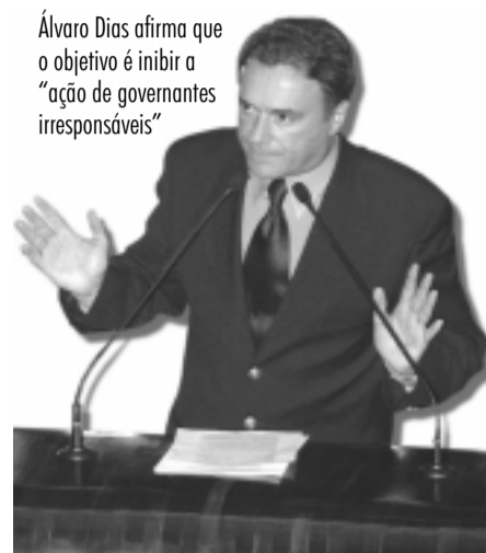
Álvaro Dias afirma que o objetivo é inibir a “ação de governantes irresponsáveis”

Afirmando que a dívida pública é causa preponderante da crise que o país atravessa, Álvaro Dias ressaltou que seu projeto propõe normas inibidoras da “ação de governantes irresponsáveis”. De acordo com o senador, o resultado da ação desses governantes é uma máquina inchada, a criação de estruturas ociosas e o “péssimo serviço público apresentado”. Ele observou que seu projeto prevê o controle dos gastos públicos, passando pelo ajuste fiscal e a reestruturação do Estado que envolva a racionalização da administração, com cortes nas estruturas su-