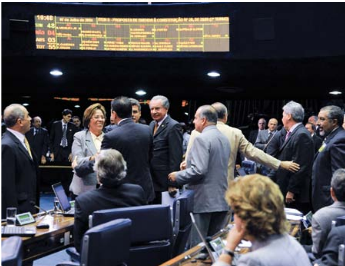
As duas emendas que deverão ser incorporadas à Constituição receberam aprovação final dos senadores na noite da última quarta