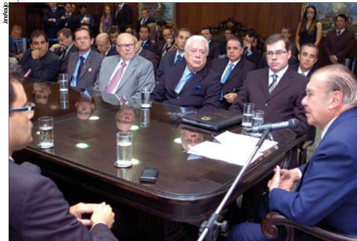
O presidente do Senado, José Sarney, recebe em seu gabinete comissão de juristas criada para apresentar proposta

E, ainda, dois membros da atual legislatura vão concorrer a deputado federal – Sérgio Guerra (PSDB-PE) e Eduardo Azeredo (PSDB-MG) – e um a suplente de senador. A senadora Patrícia Saboya (PDT-CE) concorrerá ao cargo de deputada estadual. Por outro lado, 12 senadores – entre eles Serys Silhessarenko (PT-MT) e Sérgio Zambiasi (PTB-RS) – decidiram não se candidatar a nenhum cargo político.