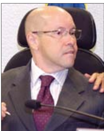
Demostenes defende norma ampla para que direito tenha eficácia

Em voto favorável à proposta, aprovado pela Comissão de Constituição, Justiça e Cidadania (CCJ), Demostenes Torres (DEM-GO) afirma que o direito de o cidadão obter dos órgãos públicos informações de seu interesse particular ou coletivo deve ser regulamentado com a amplitude necessária para que tenha eficácia.