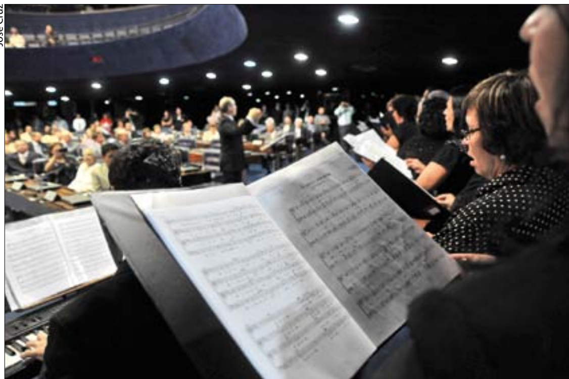
Membros da congregação batista cantam em Plenário: denominação está presente no Brasil desde o século 19

Além da ênfase na formação e sustentação dos valores da família e na assistência social, as igrejas também atuam pela educação, disse ele. No país, funcionam dois colégios, um em Brasília e outro na capital de Tocantins, Palmas.