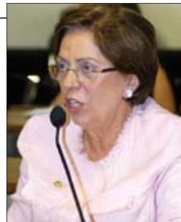
Rosalba Ciarlini é autora da proposta, que já foi votada em primeiro turno

De acordo com Jucá, para que não sejam inviabilizadas as deliberações importantes do Senado devido ao período eleitoral, no mês de setembro também será realizado um esforço concentrado, ainda sem data marcada.