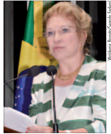
Pelas mulheres brasileiras, Marta Suplicy agradece ao STF por decisão