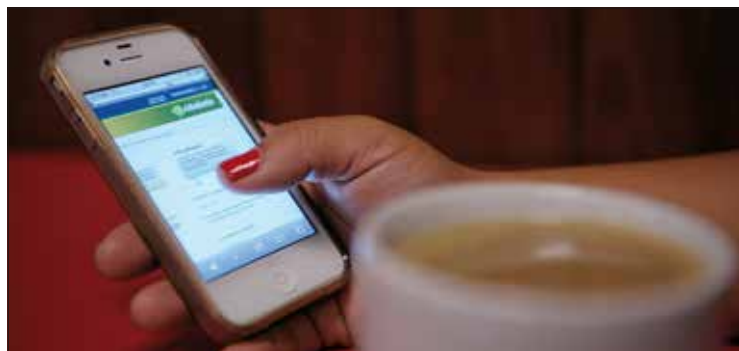
Internauta pode mandar perguntas e informações por meio do Portal e-Cidadania

tão escolhida a comissão em que será ouvido, dependendo da área de atuação. Após a leitura do relatório, é feito o pedido de vista coletiva para os senadores analisarem a indicação. Em seguida, é realizada a arguição pública da autoridade e a indicação é submetida à votação no colegiado. Se aprovada, segue para mais uma votação secreta e nominal no Plenário. São necessários 41 votos favoráveis dos 81 senadores para aprovar uma indicação.