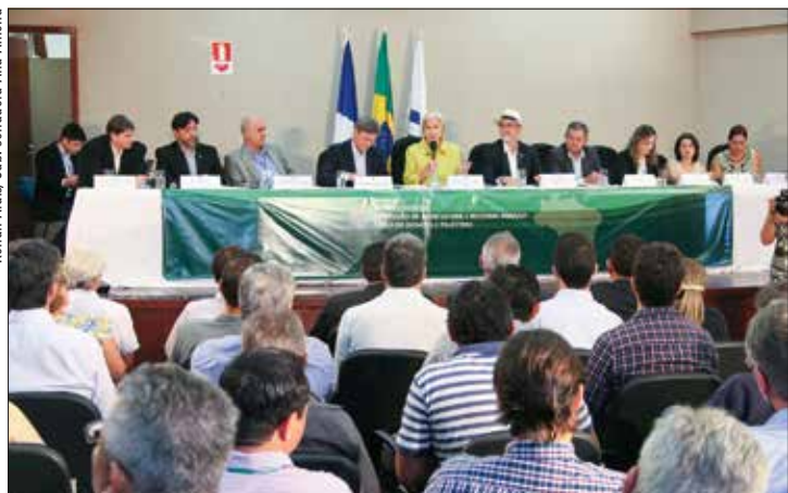
Senadores Dário Berger, Ana Amélia e Donizeti Nogueira durante a audiência

Já foram comprovados prejuízos de R$ 6 bilhões aos cofres públicos, mas auditores envolvidos na operação avaliam que a fraude pode ultrapassar R$ 19 bilhões. A comissão é presidida por Ataídes Oliveira (PSDB-TO) e tem como relatora Vanessa Grazziotin (PCdoB-AM).