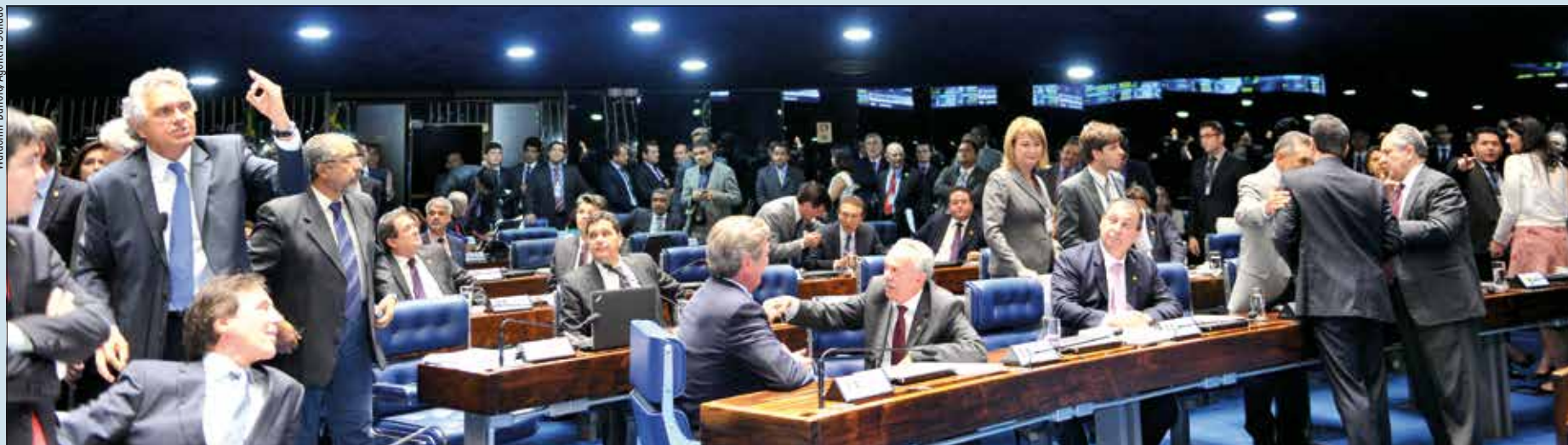
Senadores debatem medidas provisórias durante votação em Plenário: críticas ao endurecimento do seguro-desemprego, vitória contra o fator previdenciário e protestos contra os “contrabandos legislativos”