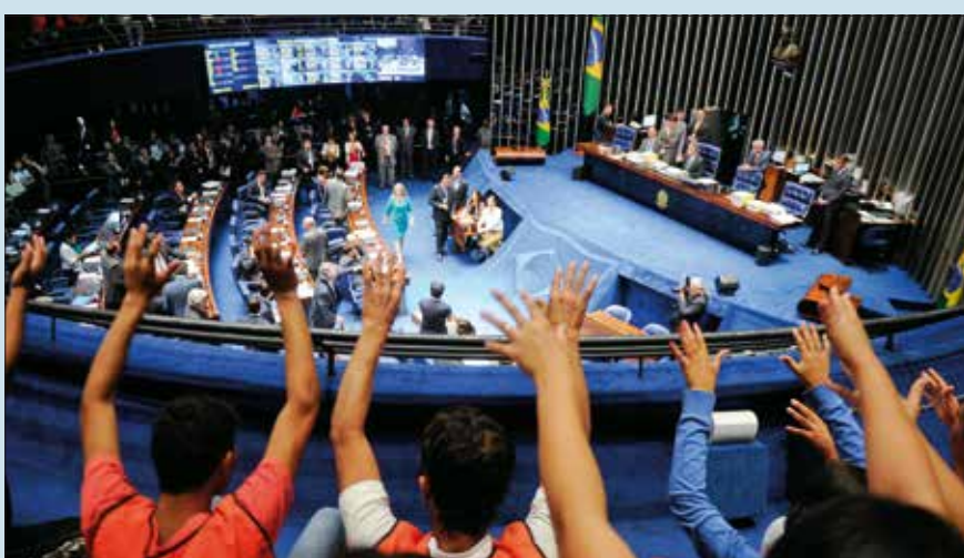
Manifestantes protestam na galeria do Senado e pedem rejeição da MP do seguro-desemprego

que trata do auxílio-doença e da pensão por morte; e a MP 668, que aumenta a tributação de produtos importados. 8