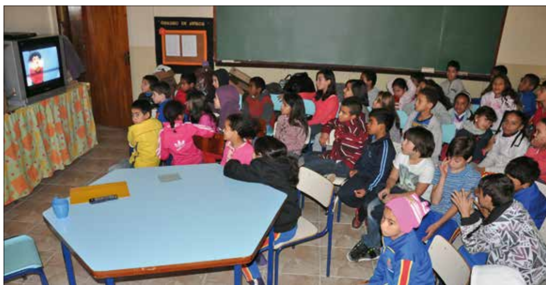
O autor da proposta, Cristovam Buarque, defende o ensino integral, como na escola do município de Mairiporã (SP)

que a Comissão de Constituição e Justiça (CCJ) já havia manifestado preocupação semelhante ao aprovar o PLS 320/2008 com uma emenda. A mudança imprimiu caráter autorizativo ao dispositivo do projeto que criava a Carreira Nacional do Magistério da Educação de Base (CNM).