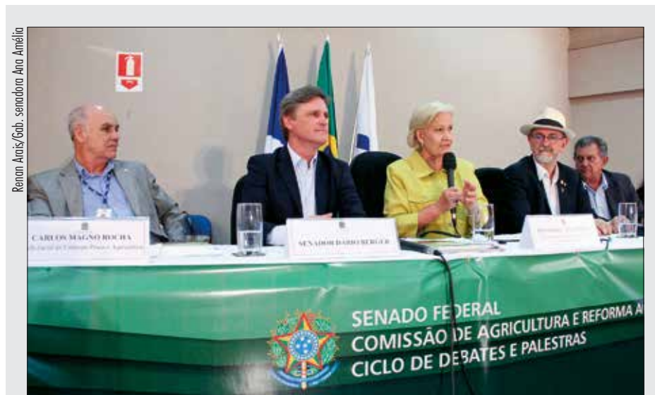
Ana Amélia, entre os senadores Dário Berger e Donizeti Nogueira, preside audiência em Palmas