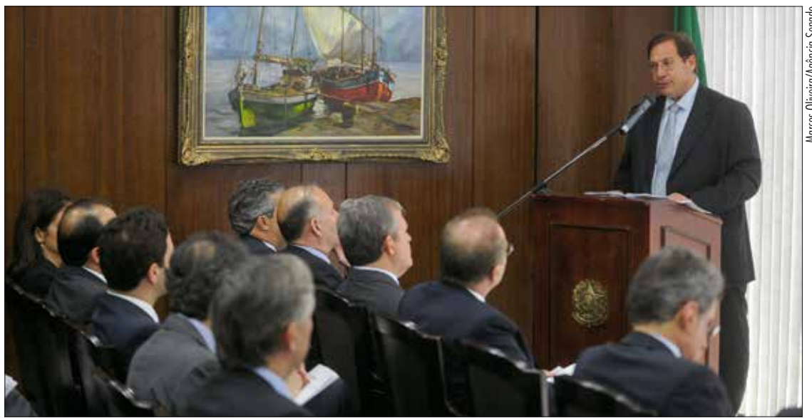
Luis Felipe Salomão, do Superior Tribunal de Justiça, discursando na entrega do anteprojeto da Lei da Arbitragem, em 2013

O projeto de Lei da Mediação tem como propósito ampliar as hipóteses em que é possível a utilização da mediação, inclusive quando o conflito envolver a administração pública.