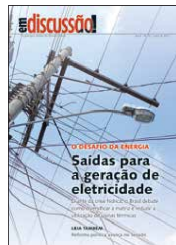
Fontes alternativas de energia estão entre os pontos abordados na revista

A revista entrevistou senadores que têm propostas para alterar a legislação do setor e especialistas, além de compilar os registros de audiências públicas, de modo a oferecer aos leitores um amplo painel da energia elétrica no contexto da crise hídrica.