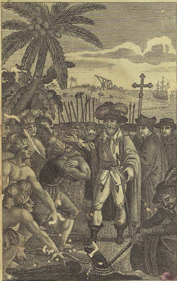
Chegada a ... Thomé de Souza,