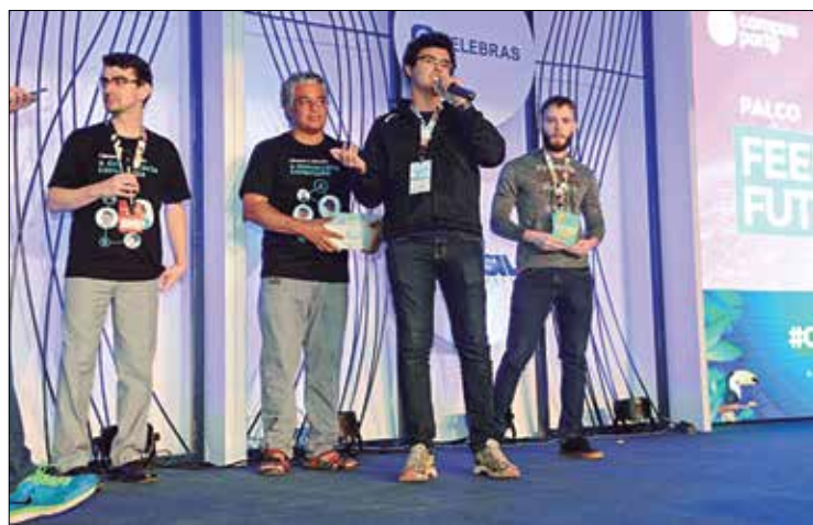
Equipe cria aplicativo que descomplica compreensão do trajeto dos textos

— Acho importante acompanhar porque, direta ou indiretamente, os projetos afetam as nossas vidas. Mas não é uma coisa fácil e intuitiva. O passo a passo para achar e compre-