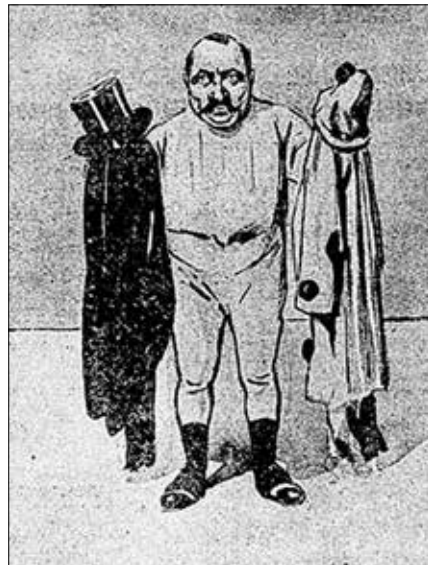
Charge publicada após morte de Rio Branco mostra brasileiro dividido entre o luto e a folia