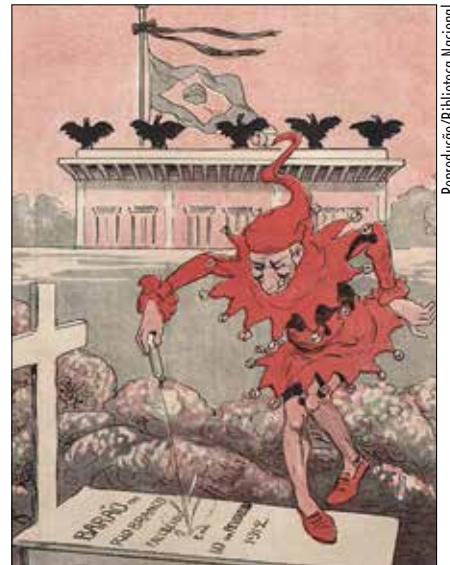
Para parte da imprensa, quem pulou o 1º Carnaval de 1912 desrespeitou Rio Branco

na disputa com os franceses, o pleito deles era chegar até o Rio Amazonas. Foi graças a Rio Branco que isso não aconteceu.