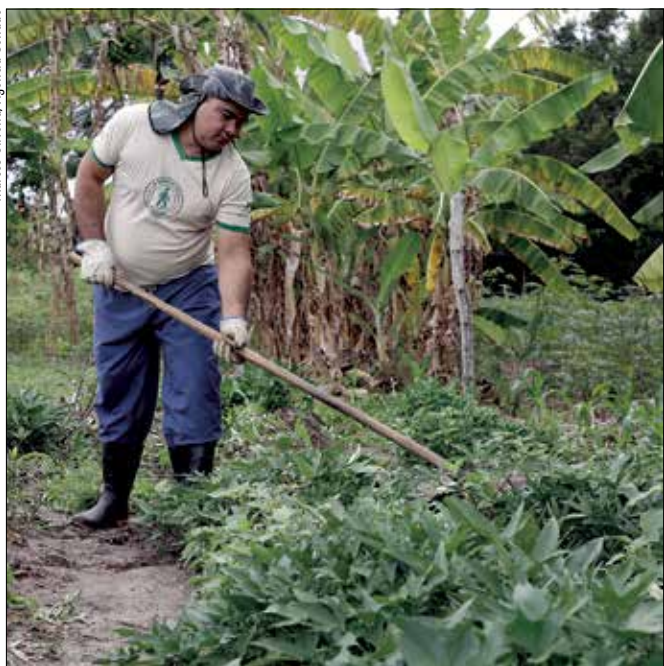
A PEC iguala a idade para aposentadoria rural de homens e mulheres

Senadores prestam homenagem às mulheres 2