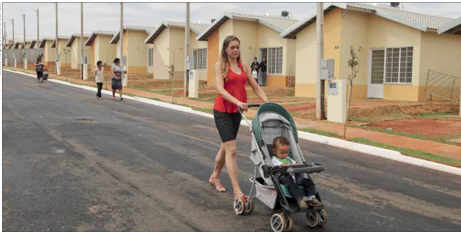
Proposta muda a Lei do FGTS para permitir que o trabalhador use o fundo não só em imóvel pessoal, mas também para quitar ou reduzir financiamento de familiares

A Comissão de Assuntos Econômicos pode votar amanhã projeto que autoriza o resgate do FGTS para a quitação ou amortização de débitos de imóveis de pais ou filhos do trabalhador titular da conta.