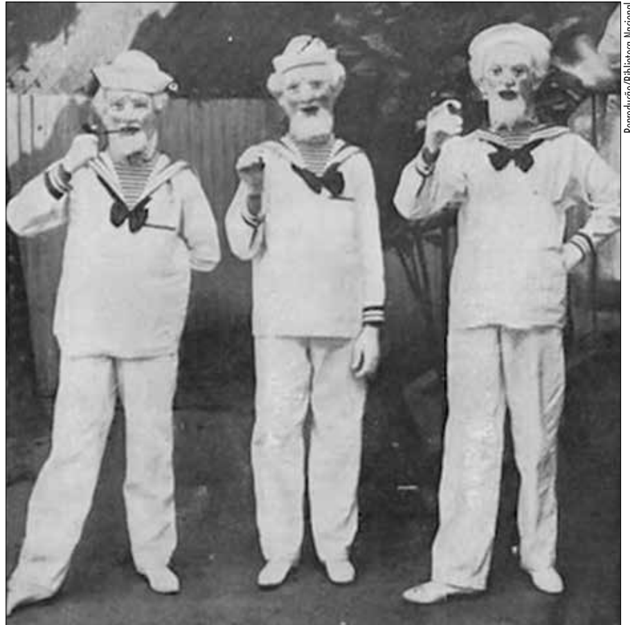
Em foto publicada pela revista O Malho , cariocas se divertem no segundo Carnaval de 1912

— Se juntarmos todas as áreas que Rio Branco ganhou para o Brasil, teremos um território equivalente a toda a Região Sul mais o estado de Pernambuco. Não é pouca coisa. Além disso, é preciso lembrar que,