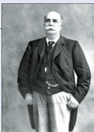
Rio Branco foi responsável por concluir o traçado das fronteiras