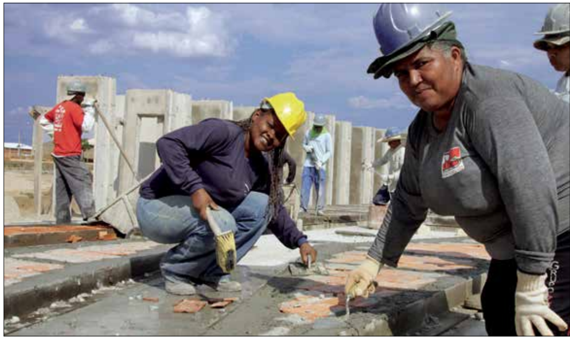
Parlamentares lembraram que as trabalhadoras têm rendimento médio 26% menor do que o dos trabalhadores