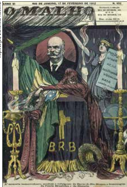
Revista noticia morte do Barão do Rio Branco em fevereiro de 1912: herói nacional

SAIBA MAIS Veja mais imagens do Carnaval de 1912: http://bit.ly/Carnaval1912