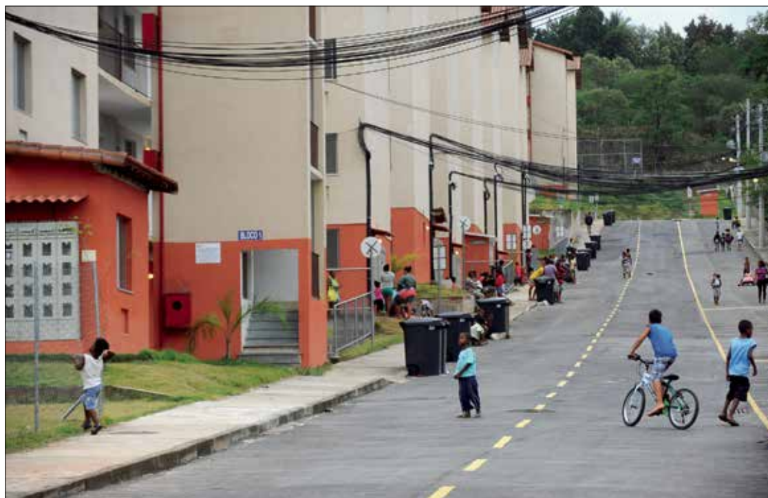
De acordo com a proposta, o saldo do FGTS poderá ser usado para quitar ou amortizar financiamento de imóvel

A proposta, apresentada originalmente pelo ex-senador Donizeti Nogueira, já foi aprovada na Comissão de Assuntos Sociais (CAS) e tem votação final na CAE — só irá a Plenário se houver requerimento para isso.