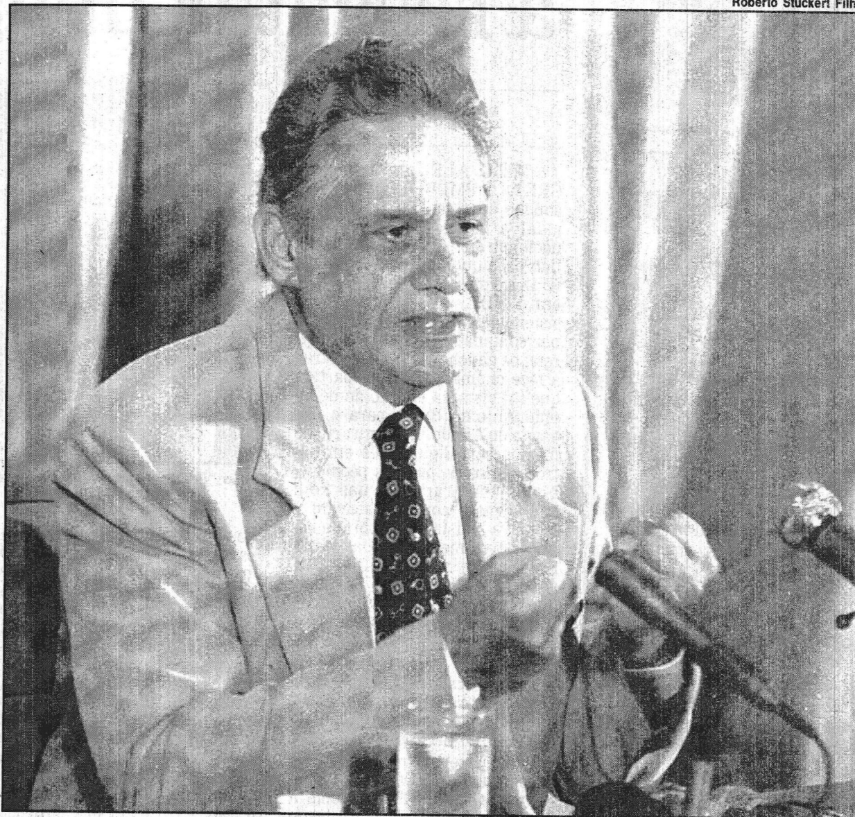
Roberto Stuckert Filho