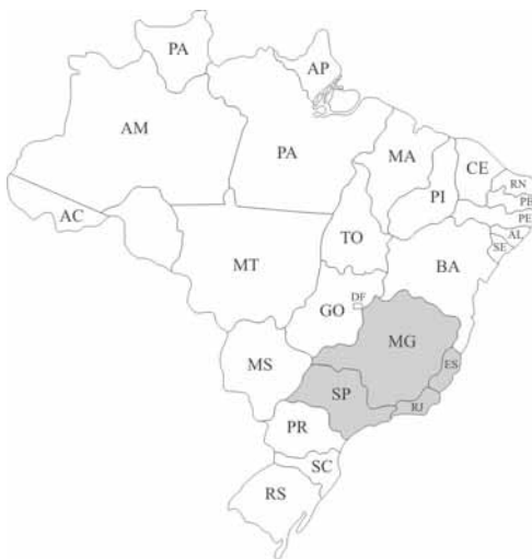
Tabela de Distribuição Anual de Royalties da Região Sudeste: São Paulo, Minas Gerais, Rio de Janeiro e Espírito Santo