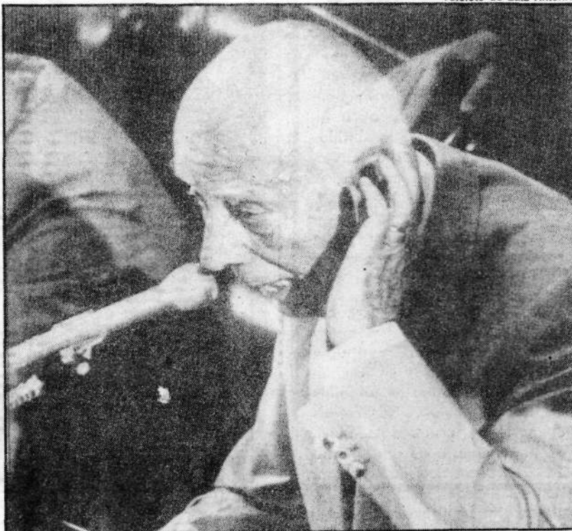
Ulysses tenta abafar o barulho do plenário para fazer-se ouvir ao microfone

O estado de sítio poderá ser decretado se comprovada a ineficácia do estado de defesa para os fins a que foi decretado ou como resposta a grave repercussão nacional, além do caso de declaração de estado de guerra ou resposta a agressão armada estrangeira.