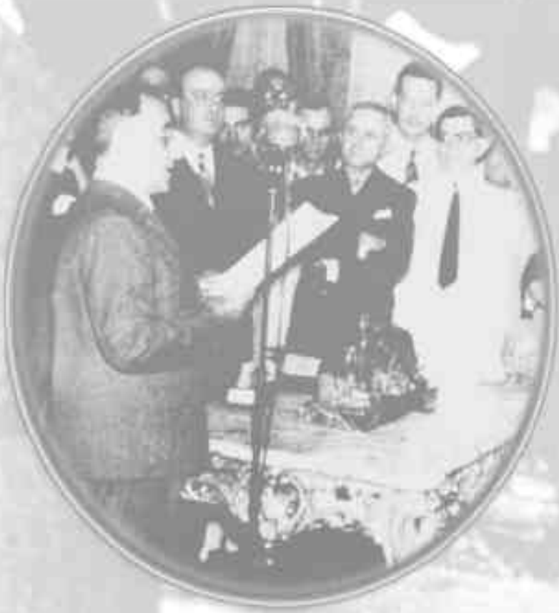
O Presidente Getúlio Vargas falando à Nação na instauração do Estado Novo, presentes os Ministros Eurico Gaspar Dutra e Francisco Campos.