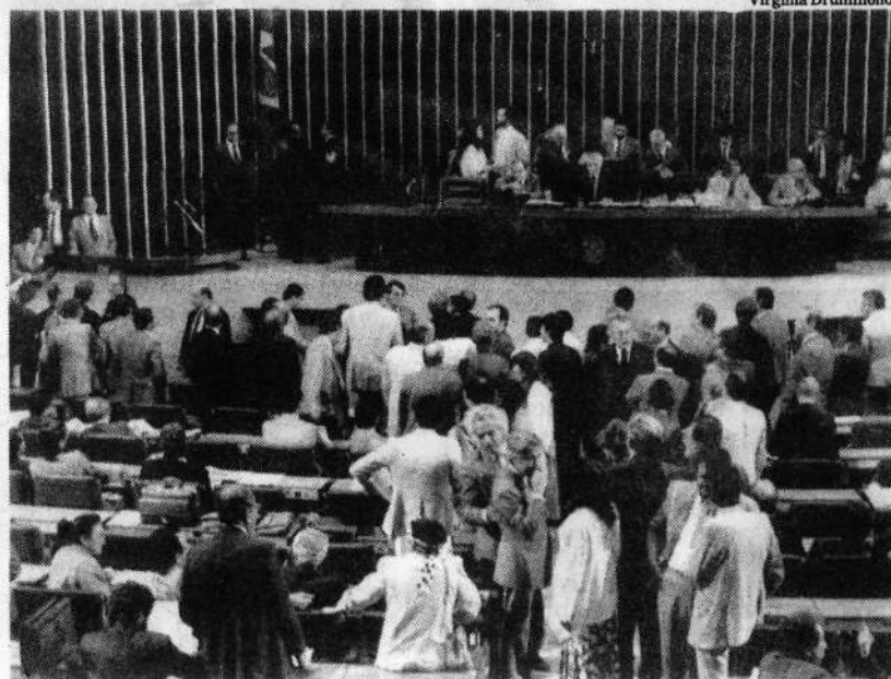
Encerramento da sessão de ontem sem quórum do Congresso constituinte

Entre 36 pontos sobre os quais as lideranças chegaram a acordo para manter o texto ou aprovar destaques que modificam partes dele, estão a classificação do racismo como crime inafiançável e imprescritível; a vedação da penhora de pequenas propriedades rurais e a garantia do direito adquirido.