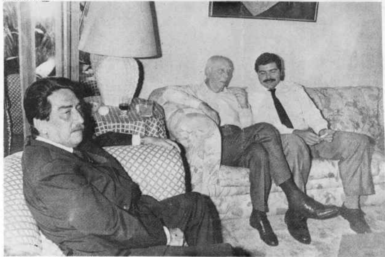
O governador Cafeteira, Ulysses e o deputado Sarney Filho: a família do presidente prestigia Archer