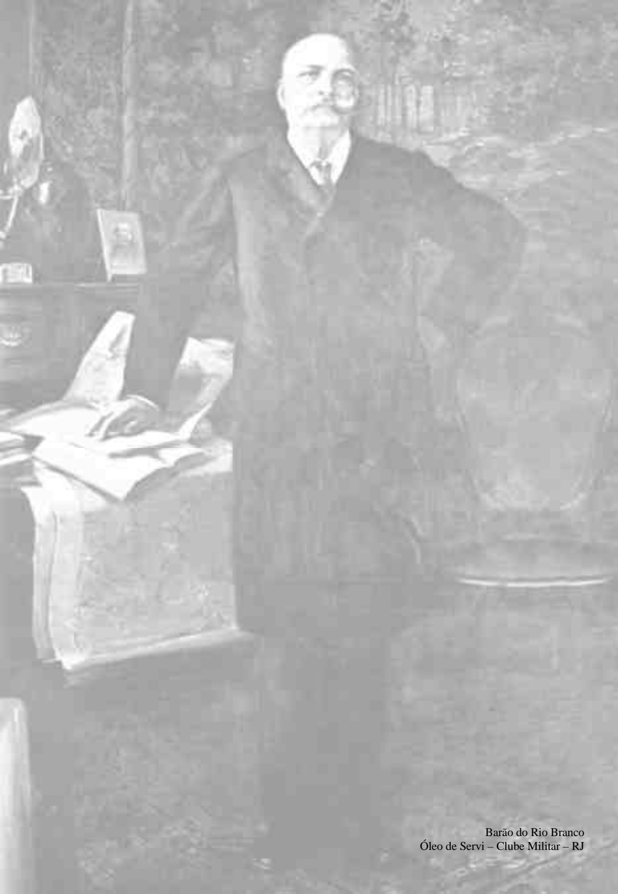
Barão do Rio Branco Óleo de Servi – Clube Militar – RJ