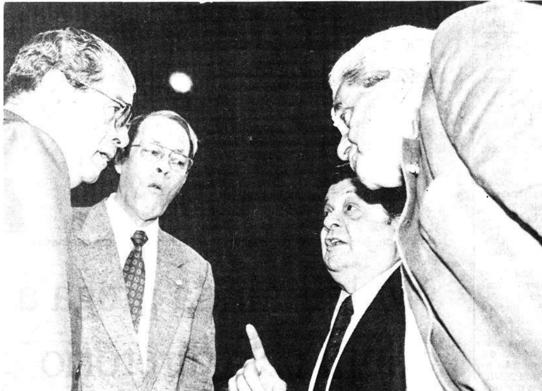
Passarinho, Sant'Anna, Delfim e Amaral: o Centrão se prepara pela economia