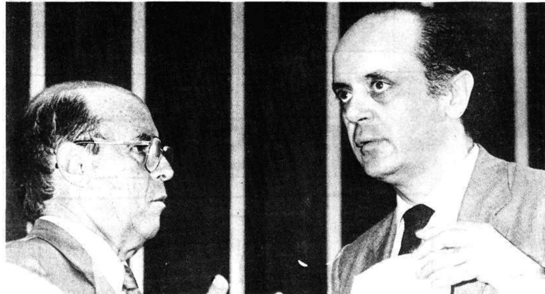
Dornelles e Serra: dúvidas quanto ao aumento ou redução dos impostos