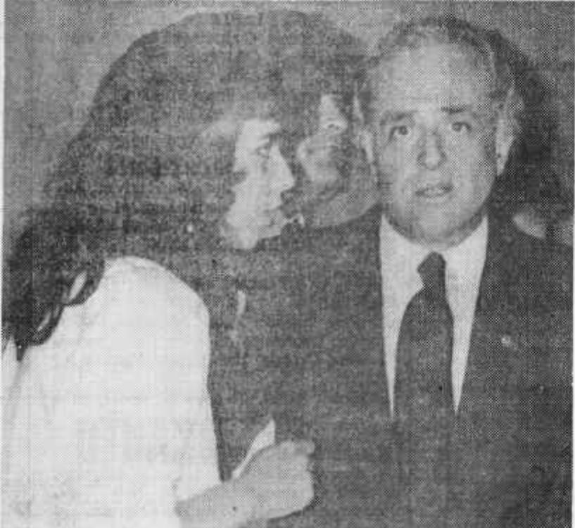
Os líderes ruralistas circulam e trocam informações