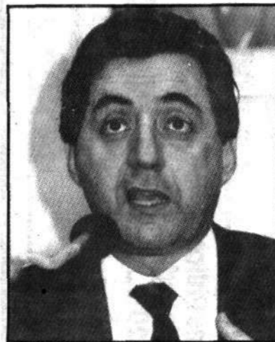
Afif: "Interesses corporativistas"

sempre foi uma norma das nossas Constituições. Em 1946, foram efetivados inclusive aqueles que trabalharam na Constituinte. E é muito justo que seja assim. Votamos nas disposições permanentes um texto que garante a relação de emprego. E o servidor público, fica instável? Se está há cinco anos na função e não foi demitido é porque interessa ao serviço público ou o administrador é muito incompetente — disse o parlamentar.