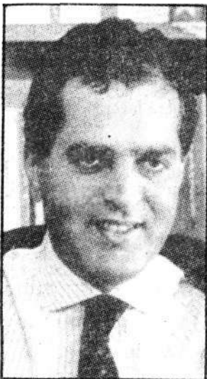
Luis Eduardo Magalhães

BRASÍLIA — O forte apelo emocional da tese nacionalista e a ação corporativista na Constituinte são os fatores responsáveis pelo enfraquecimento do Centrão, que vem registrando, através de votos, um número cada vez menor de adesões as suas propostas. Esta é a avaliação das principais lideranças do grupo para explicar os sucessivos insucessos nas votações do Capítulo I do Título da Ordem Econômica.