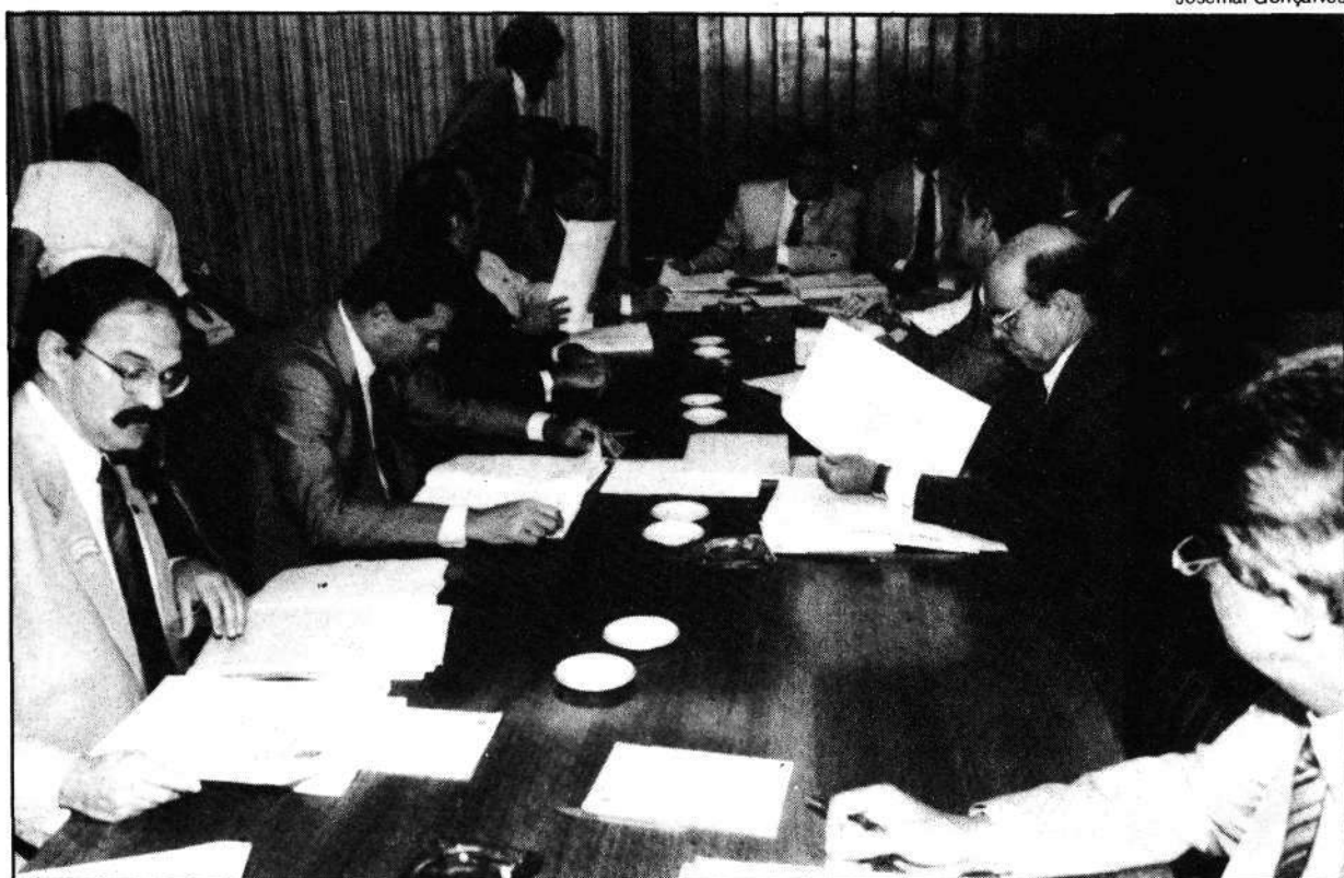
Líderes do PMDB e do Centrão voltam a se reunir hoje. Ontem não chegaram a nenhum acordo