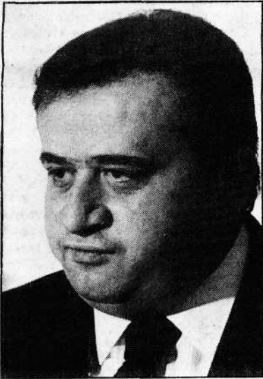
Fortes propõe a prorrogação