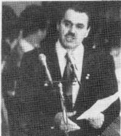
Deputado Matheus Iensen (PMDB-PR)

Iensen se vangloria de ter sido "o primeiro que calculou que essa Constituinte não ficava pronta antes de setembro", argumento que sustenta a tese da inviabilidade de eleições presidenciais esse ano. "Eleição sai muito caro, é um