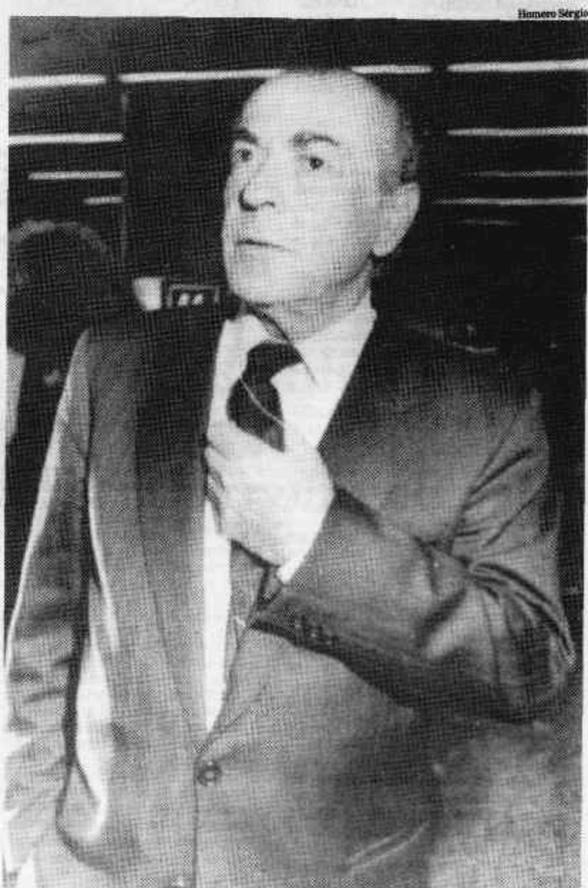
Brizola, 1º na pesquisa, ao chegar ontem do Peru ao aeroporto do Galeão

Brizola e Motta desceram às 20h15, uma hora depois do início do encontro. Brizola despediu-se do ex-governador do Ceará, cumprimentou correligionários e, enquanto dava largas passadas pelo saguão do prédio, ditou suas declarações. Ao contrário do que chegou a declarar na terça-feira, quando disse que ainda tinha esperanças na vitória do mandato de quatro anos para Sarney, Brizola afirmou que o resultado da votação "não se constituiu em nenhuma novidade. O povo brasileiro há muito já se convenceu que na Assembléia Constituinte formou-se uma maioria conservadora, de natureza elitista e autoritária". Alter-