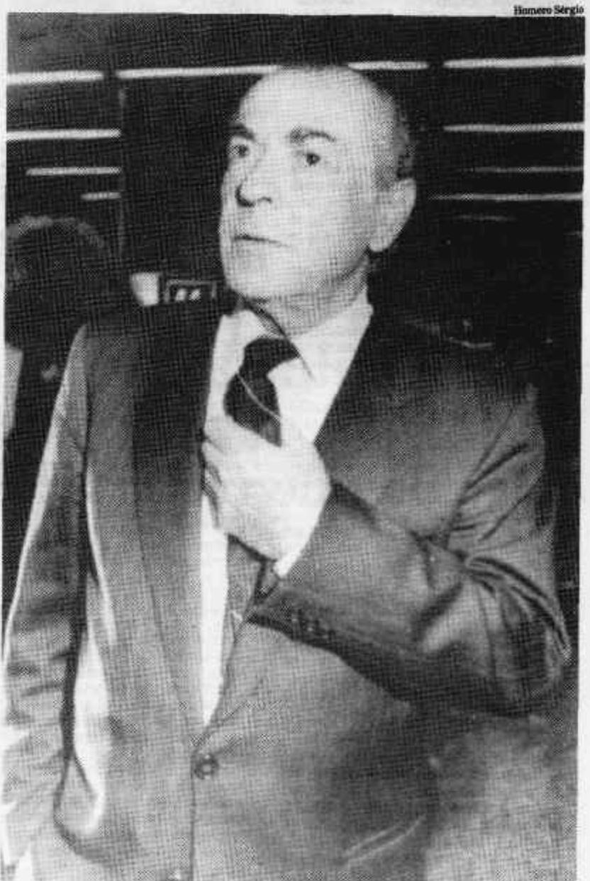
Brizola, 1º na pesquisa, ao chegar ontem do Peru ao aeroporto do Galeão

Brizola e Motta desceram às 20h15, uma hora depois do início do encontro. Brizola despediu-se do ex-governador do Ceará, cumprimentou correligionários e, enquanto dava largas passadas pelo saguão do prédio, ditou suas declarações. Ao contrário do que chegou a declarar na terça-feira, quando disse que ainda tinha esperanças na vitória do mandato de quatro anos para Sarney, Brizola afirmou que o resultado da votação "não se constituiu em nenhuma novidade. O povo brasileiro há muito já se convenceu que na Assembléia Constituinte formou-se uma maioria conservadora, de natureza elitista e autoritária". Alter-