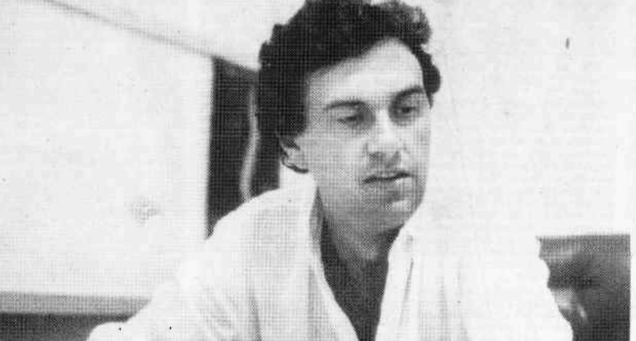
O líder rural Ronaldo Caiado, presidente licenciado da UDR, em seu consultório médico na cidade de Goiânia

a disposição de Caiado será dedicar seu tempo às duas fazendas em Goiás e à medicina — de resto, suas maiores paixões, além da política. O trabalho no campo recomeçou há dez dias, quando retomou o comando da colheita do feijão, milho e arroz, logo depois do a astamento da presidência da UDR.