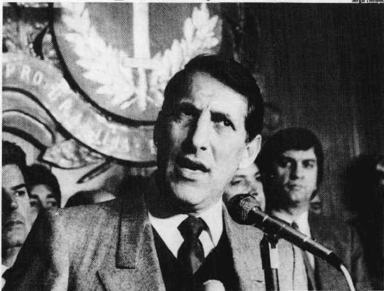
Quercia no Palácio dos Bandeirantes; ao fundo, vê-se o lema "Pro Brasilia fiant eximia" (fazendo o melhor pelo Brasil)

Por quê então os meios políticos o consideram um provável candidato? "É natural", disse Quércia. "Sou o governador de São Paulo e as coisas aqui vão bem, mas repito que não sou candidato." Parlamentares paulistas, por outro lado, acreditam que nem tudo caminha tão bem no