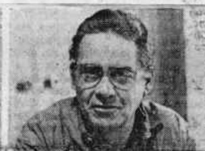
Fernando Henrique Cardoso