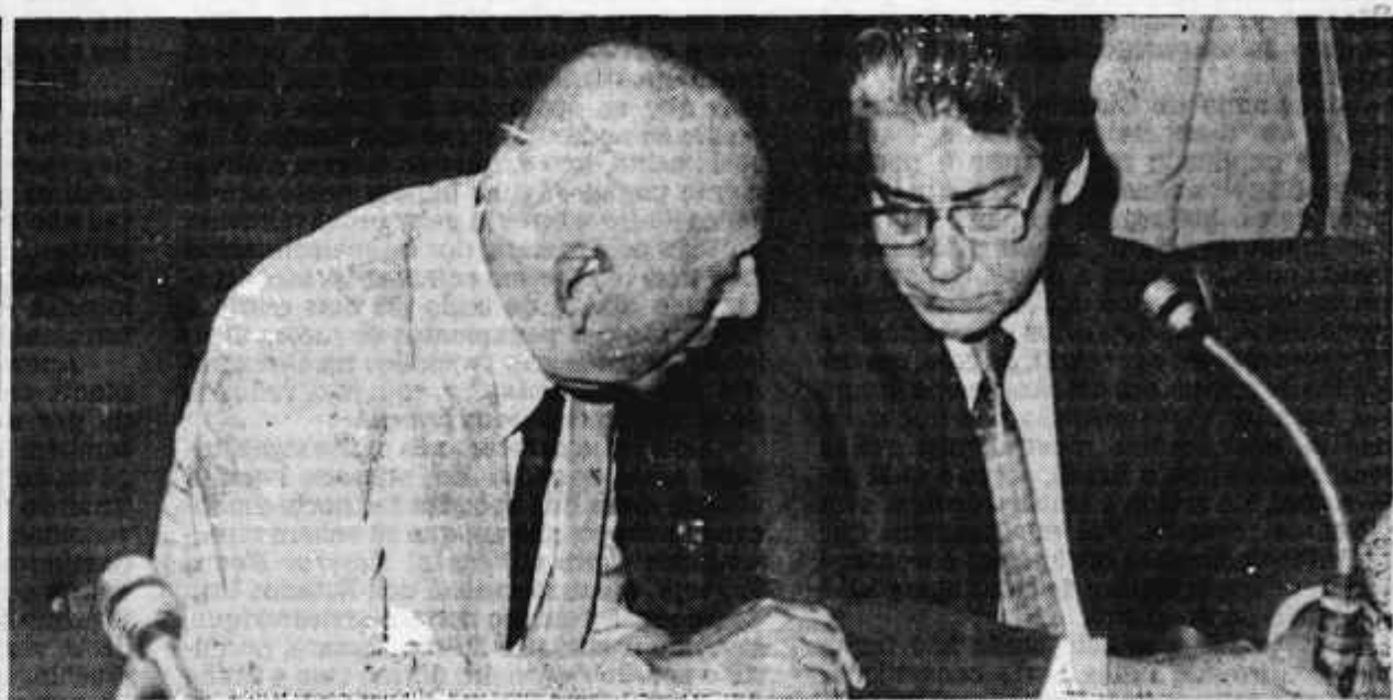
Constituintes queixam-se de que Ulysses e Covas tomam decisões sem consultá-los

Na Comissão de Ordem Social as lideranças do PMDB, e do PFL não apoiaram a pretensão de Domingos Leonelli (BA) para a função de relator-geral. O preferido era o senador estreante Almir Gabriel, do Pará. Sem condições de ser indicado relator-geral, Domingos Leonelli lançou-se candidato a presidente. Se tivesse sido eleito os moderados romperiam o acordo na Comissão de Ordem Econômica, indicando Roberto Cardoso Alves para relator-geral, pretendendo Severo Gomes. Na presidência dos trabalhos o moderado Saldanha Derzi (MS) protegiu a apuração, aguardando definição na Comissão de Ordem Social. Leonelli resolveu desistir de postular a presidência da Comissão de Ordem Social, para tentar ser relator-geral. Alguns metros adiante, apesar da insatisfação, PDS e PFL cumpriram o acordo, aceitando Severo Gomes para relator-geral da Comissão de Ordem Econômica, preferindo Cardoso Alves.