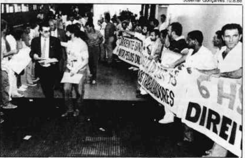
Metalúrgicos pressionaram pela jornada de 6 horas no 2º turno

Na democracia participativa consagra a iniciativa popular para propor projetos de lei e o voto contínuo obrigatório aos maiores de 18 anos e facultativo a partir dos 16 anos. A tortura, o terrorismo e o racismo são crimes inafiançáveis.