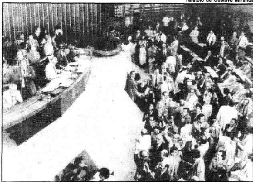
Plenário se mobiliza para votar emenda que pune plantador de maconha

Além de não receber indenização pelas terras, usadas para aquele fim, os proprietários ficarão sujeitos a outras sanções previstas em lei e perderão todos os bens adquiridos com rendimentos provenientes do tráfico de drogas. Estes bens reverterão em benefício de instituições especializadas na recuperação e no tratamento de viciados.