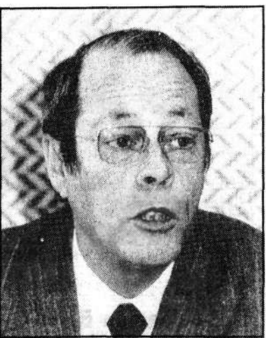
Sant'Anna acompanha negociações

Tanto é assim que a proposta inicial envolvia recursos da ordem de CZ$ 1 trilhão. Agora já existem