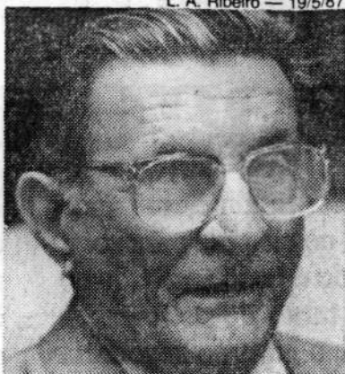
Exedito: falta cacife

em jornais do Rio e São Paulo no último dia 13. O jurista prega a necessidade de se votar novamente em segundo turno todo o projeto, capítulo por capítulo, e não por emendas supressivas. Exame na Emenda Constitucional nº 36, feito pela Consultoria Jurídica do presidente da República, confirmou que o projeto poderá ser simplesmente rejeitado. Até então prevalecia a posição da Mesa, presidida por Ulysses, que passava ao largo deste dispositivo, optando pela aprovação simbólica do projeto, sob o argumento de que ele já havia passado por exaustivo processo de votação.