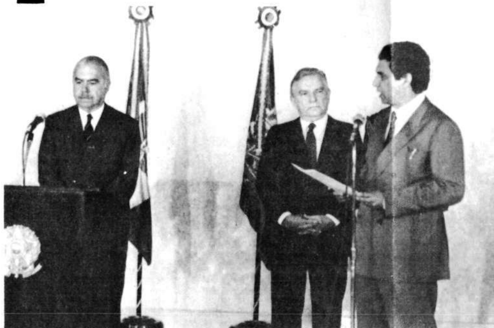
Sarney, Archer e Barbalho, na posse.

O ministro da Justiça, Paulo Brossard, disse ontem, em Porto Alegre, que a demissão dos ministros ligados ao deputado Ulysses Guimarães não representa a existência de um confronto entre ele e o presidente Sarney: "O relacionamento entre os dois presidentes sempre foi o melhor possível, e continua sendo".