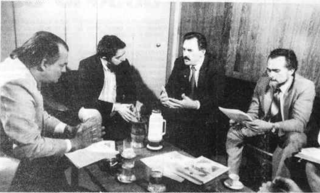
Roberto Freire, Lula, Nelson Jobim e Genoio: o PMDB e as esquerdas negociam

O presidente da Constituinte, Ulysses Guimarães, anunciou ontem que o início da votação do Projeto B de Constituição em 2º Turno não vai mais acontecer no dia 21, como se previa. A primeira sessão plenária para votação do projeto foi convocada para as 14h30 do dia 25 de julho, segunda-feira.