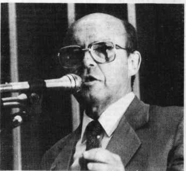
Dornelles na tribuna: o País pode sair perdendo

Lembrando que o País precisa do máximo de investimentos externos que puder captar no disputado mercado internacional de capitais e de tecnologias, o ex-ministro da Fazenda reiterou que as desconfianças e preconceitos contra o investimento estrangeiro, "sempre visto, erroneamente, como uma espécie de inimigo externo a ser vencido e esmagado", ameaçam criar no País condenável política de cartórios, reservas de mercado e discriminações "incompreensíveis e inaceitáveis".