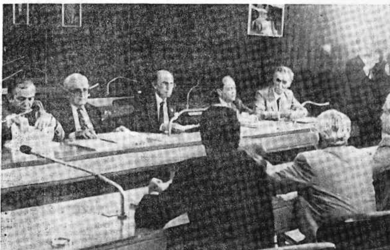
O Centrão e o Grupo dos 32 prevêem consenso em 95% das propostas de emendas