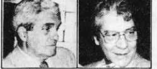
Amaral Neto e Mário Covas

malmente, com sessões diárias, a partir desta semana até o dia 27 — quando a Constituinte voltará a reunir-se para iniciar a votação do projeto de Constituição —, mas não há acordo ainda sobre a pauta de votação.