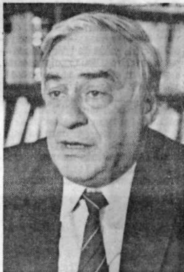
26/12/88