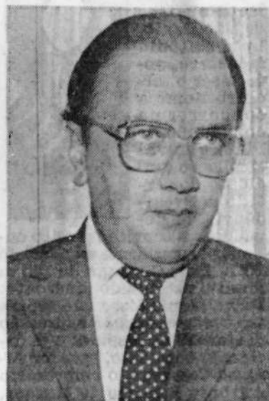
Carlos Rennó/AE - 9/12/88

A incapacidade do Congresso Nacional de dar andamento à nova Constituição tem solução, opina Ruy Altenfelder: basta mobilizar os assessores técnicos parlamentares para apressar o trabalho das comissões. "Existem técnicos altamente qualificados no Congresso que não estão sendo bem aproveitados", alerta. O presidente da Comissão de Assuntos Legislativos da CNI acredita que só a soma do esforço dos técnicos e dos políticos transformará em realidade a principal bandeira da campanha do deputado e presidente Ulysses Guimarães — resgatar a cidadania do povo brasileiro através da nova Constituição. "Até agora", diz Altenfelder, "isso ainda não foi possível".