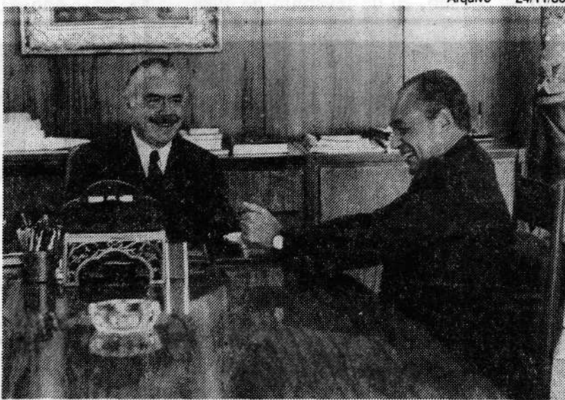
Waldir: "Sarney está confundindo os personagens"

Após a leitura da nota de Waldir pelas estações de TV da Bahia, o Palácio do Planalto transmitiu a resposta de Sarney, divulgada em edição extraordinária pela TV Aratu: "Em nenhum momento fiz qualquer ofensa pessoal ao governador Waldir Pires, de quem, aliás, não tenho recebido o mesmo tratamento. Durante o tempo em que foi ministro, só recebi lisonjas e elogios. Eu não mudei".