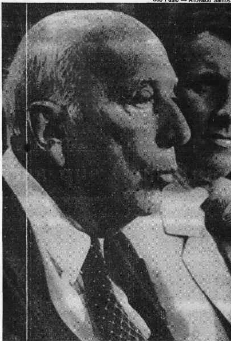
Ulysses, cauteloso, não disse se quer 4 ou 5 anos

Ao concluir, Ulysses contestou mais uma vez as críticas à demora na conclusão dos trabalhos constituintes.