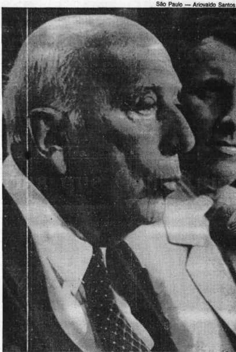
Ulysses, cauteloso, não disse se quer 4 ou 5 anos

Ao concluir, Ulysses contestou mais uma vez as críticas à demora na conclusão dos trabalhos constituintes.