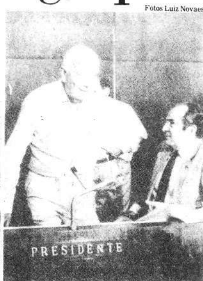
Durante as negociações, um gato entra na Comissão de Transportes da Câmara; no destaque, Ulysses Guimarães e o relator Bernardo Cabral