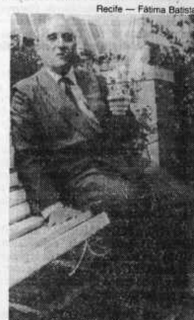
Ferreira: falta bom senso

jurista acredita que a ordem social poderia muito bem ter ficado para as leis ordinárias, como acontece em quase todas as constituições do mundo: "A falta de uma palavra sobre educação nas constituições americana e francesa, por exemplo, não impede que todos tenham acesso à educação nesses países".