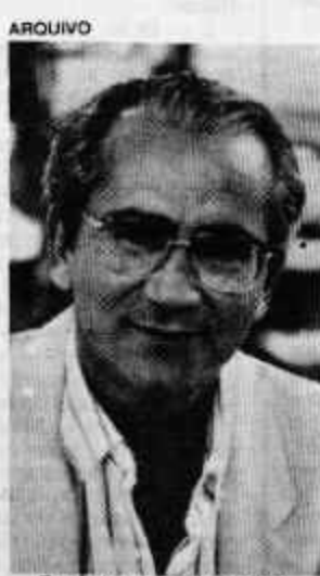
Frejat não sai do PFL

A nota conclui afirmando que o Estado não tem "um governo que exija, em Brasília, o aceleramento dos processos despropriatórios, procedimento este que era realizado de forma negativa pelos governos passados. A impressão que se tem é de que, pela avaliação do governo estadual, a questão da reforma agrária é um problema da esfera federal, sem interferências do governador".