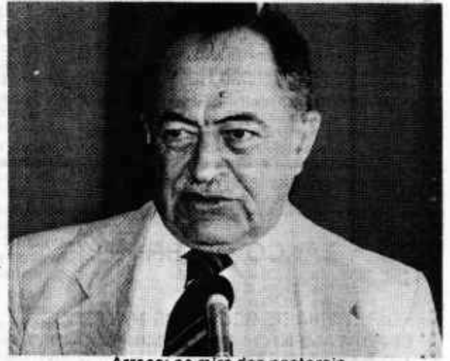
Arraes: na mira das pastorais

O governador insiste que a matéria deve ser discutida em nível de convenção — explicou Aníbal Teixeira.