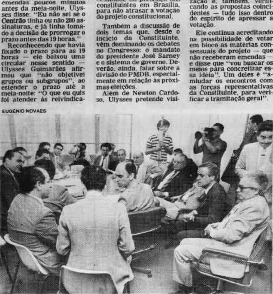
A executiva do PFL se reúne: prévias, só depois de terminada a Constituição