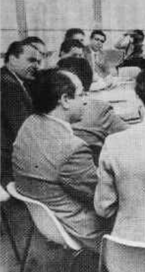
A executiva do PFL se reúne: prévias, só depois de terminada a Constituição