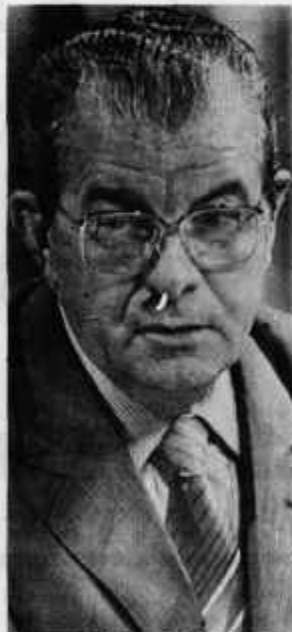
Passarinho prevê pressão

"A discussão disso é uma bobagem", assegura o senador Richa para quem es-